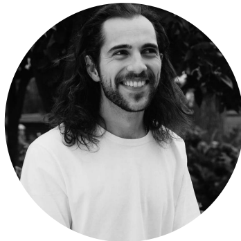
João Gamory música original